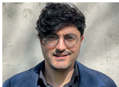
Haro Karkour Darlithydd Cysylltiadau Rhyngwladol

Mae myfyrwyr Caerdydd yn rhagorol - rwyf wedi cwrrd â myfyrwyr hynod frwdfrydig sy'n awyddus i weithio i wella'r amgylchedd a chymdeithas. Mae Cymru yn anhygoel. Mae'n wlad sydd â hanes cyfoethog i bobl sydd ar flaen y gad o ran trawsnewidiadau amgylcheddol ac economaidd, gan gynnwys y trawsnewidiad anodd (a dweud o lleiaf) o ddiwynnu ar lo. Gallwn ddysgu llawer am yr hanes hwn i helpu i ddeall yr hyn sydd ar y gweill ar gyfer newid mewn modd cyfiawn i fyd sy'n fwy diogel o ran hinsawdd.