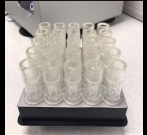
Falfiau allanadlu 3D wedi'u hargraffu Enghraifft o ailbwrpasu cyfarpar er mwyn bodloni gofynion newydd